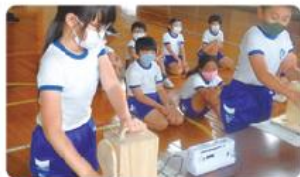
●千本小学校/4年生10人