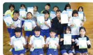
●向田小学校/4年生17人