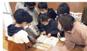
●成美小学校/4年生25人