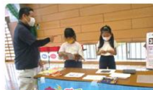
●須走小学校/4年生34人