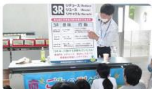
●今沢小学校/5年生59人