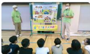
●第三小学校/4年生49人