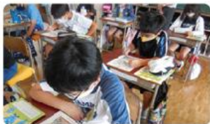
●大岡南小学校/5年生71人