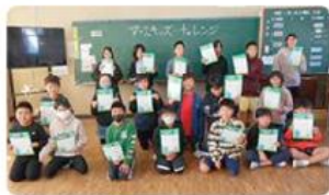
●原東小学校/5年生39人