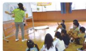
●千福が丘小学校/4年生22人