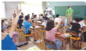
●開北小学校/5年生54人