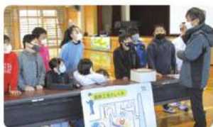
●第一小学校/5年生35人