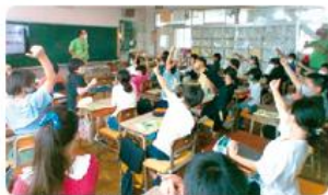
●第五小学校/5年生84人