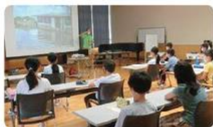
●第四小学校/5年生80人