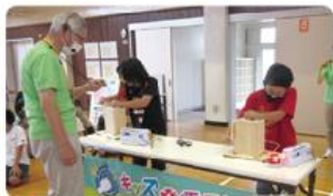
●大岡小学校/5年生62人