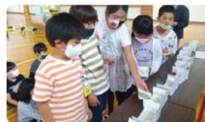
●御殿場南小学校/4年生118人