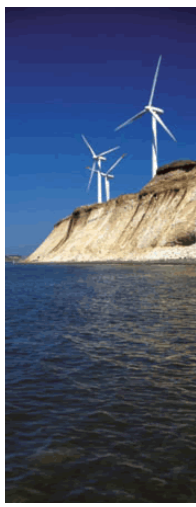
▲ タペストリー 左:F01 中央:F02 右:F03