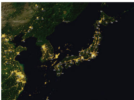
▲ A04-08 夜の日本～横断幕タペストリー～