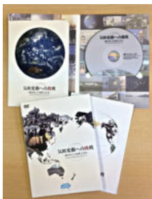
▲ DVD教材 気候変動への挑戦