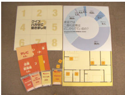
▲ A03-04 エコのタネをみつけよう