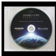
▲ DVD教材-岩合光昭スペシャル