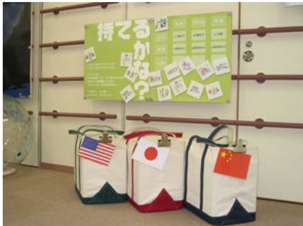
▲ A02-01 持てるかな?～エネルギーのかばん～