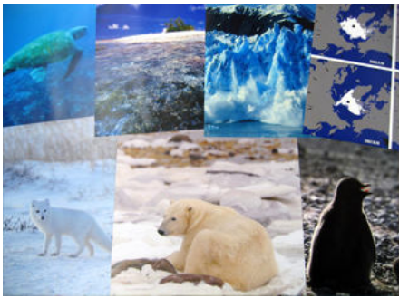
▲ A01-02 敏感な私たち