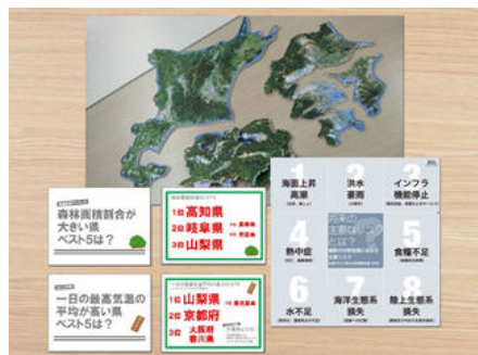
▲ A04-07 教えてニッポン!