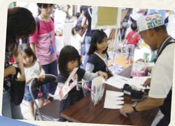
「親子エコ緑日」では、子どもたちが牛乳などの紙パックを使った帽子づくりに挑戦。

ユーカリが丘親子の日実行委員会は、環境問題と少子高齢化問題を一体としてとらえ、「エコを楽しみながら考える」街づくりに取り組んでいます。約3万人が参加する「ユーカリ祭り」では、新交通システム「山万ユーカリが丘線」を無料開放して「ノーカー」の取り組みを促し、マイバッグの持参を呼びかけたほか、「まちエコ宣言」を発表。電力の一部はグリーン電力でまかないました。現在は商店会・地域住民・行政・デベロッパーとの協働による環境配慮型の街づくりを展開中です。