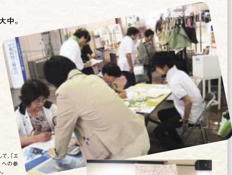
百貨店と連携して、「エコライフDAY」への参加を呼びかける。

NPO法人川口市市民環境会議は、独自の「1日環境家計簿」を活用して市民がCO2削減行動にチャレンジする、年に1日の「エコライフDAY」の取り組みを推進しています。2007年度は市民の12%にあたる61,041人が参加。活動は埼玉県内の他地域にも広がり、県全体では昨年41万人が参加しました。そろばん教室の子どもたちがCO2削減量を集計し、発表しています。企業などさまざまな組織と連携しながら活動の輪を広げています。