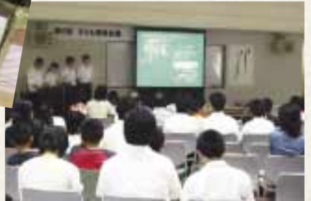
子どもたちの環境意識を高めるため、「こども環境会議」を開催してワークショップを実施。

日田市では、市内全世帯・全事業所から排出される生ごみを分別収集して資源化し、バイオマスの利活用による循環型社会の構築に取り組んでいます。また、子どもたちが環境問題の大切さを理解し、教職員・児童・生徒が一体となって「環境に良い学校づくり」に向け取り組めるよう、平成12年度に独自の「日田市学校版環境ISO認定制度」を創設しました。市内の小中学校42校全てが認定を受け、積極的に環境教育を実施しています。市町村合併により新たに加わった町村でも、約2年のうちに全ての小中学校が認定を取得し、活動を展開しています。