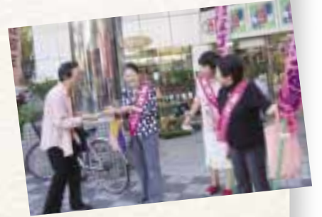
ごみを少しでも減らすため、スーパーの店頭で「マイバッグ」の持参を呼びかけるキャンペーンを実施。