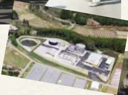
従来は焼却・埋め立て処分されていた生ごみで発電を行う「バイオマス資源化センター」。