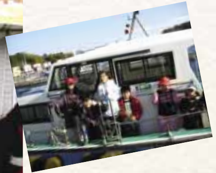
BDFは組合員の車や公用車等で利用。島と島を結ぶ渡船でも、燃料にBDFを導入する実験を進めている。