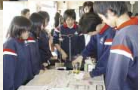
学校での環境教育の一環として、廃食用油からBDFを作る実験を行い、体験を通してバイオマスの大切さを学ぶ。

塩釜市団地水産加工業協同組合は、水産練り製品生産高が日本一という地域特性を生かして、揚げかまぼこの生産過程から発生する大量の廃食用油を資源として有効活用し、自動車や船舶の燃料「BDF (バイオディーゼル燃料)」に転換。BDF製造プラントの建設や廃食用油の回収からBDFの製造・販売までの事業運営を担っています。また、市民や行政とともに「グローバルエコシティ塩竈推進協議会」を設立。環境意識の向上と活動拡大のための普及啓発活動を展開しています。