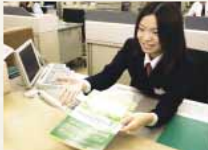
独自に作成した、一般家庭向けの「環境保全活動取り組みチェックシート」。

「きんしんエコロジー積金」では、加入者自らのCO 2 排出量削減活動も推奨。環境保全の輪の拡大に貢献している。