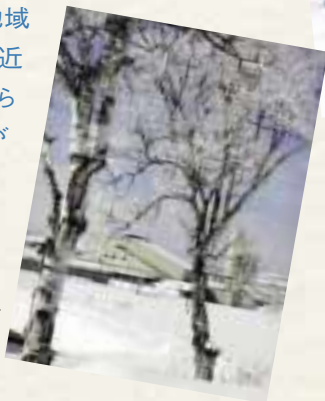
雪の冷熱で、米の保存に最適な環境を作るスノークールライスファクトリー。