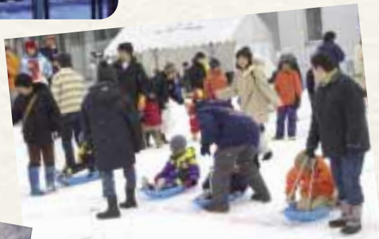
雪と共生するまちづくりを目指し、雪と親しむためのイベント「輝け雪のまちフェスタ」も開催している。

北海道でも有数の豪雪地帯、沼田町では、雪の「冷熱エネルギー」を活用した世界初の米貯蔵施設「スノークールライスファクトリー」を建設。ここに貯蔵された米を沼田産「雪中米」として出荷しています。公共施設に「雪冷房」を導入するほか、雪冷熱を活用した農作物の栽培や、学校では独自の「利雪学習」を実施。温泉旅館では「雪中そば」など、地域の食材を使った料理を提供しています。最近では個人住宅や店舗に雪冷房が採り入れられるなど、町民の間でも雪利用の取り組みが広がっています。