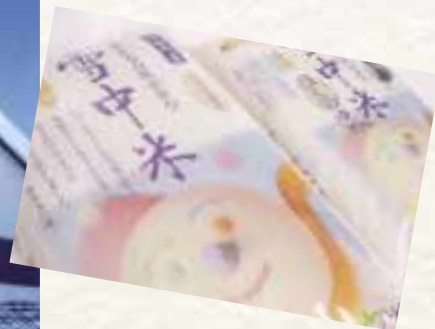
地元産の米を雪冷熱で保存した「雪中米」。新エネルギーとしての「雪」を、産業に結びつけ、まちの活性化を図る。