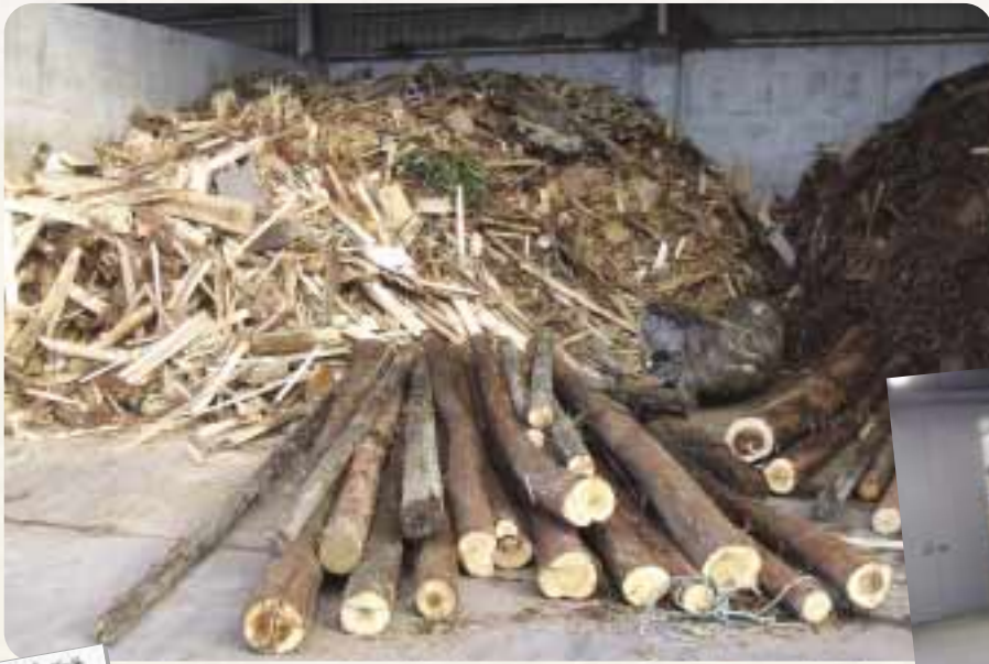
加工過程で出る木くずと、間伐で発生する未利用材を燃料とした、木質バイオマス発電施設。