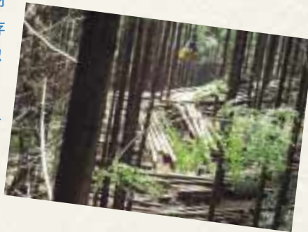
間伐により森林を手入れする。切り出した木材は発電の燃料として活用。