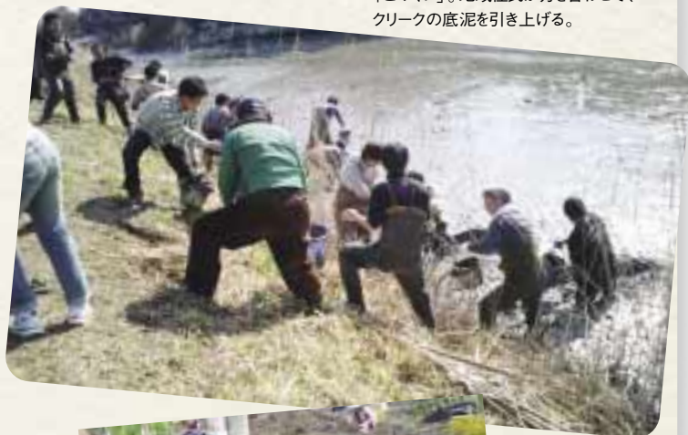
「ごみくい」。地域住民が力を合わせて、クリークの底泥を引き上げる。

クリーク文化圏である佐賀の知恵「ごみくい」とは、小川の泥を田畑にまくこと。この伝統を復活させることにより、土壌を豊かにし、循環型農業の持続的な実現を目指すとともに、水辺の生態系の再生に取り組んでいます。地元の子供会、小中学校、大学、市民等に対しては、農業体験に基づく環境教育や生涯教育を実施。地域コミュニティの再構築を図っています。地元の大学との連携により、土中・水中の有害重金属や残留農薬の分析評価も行っています。