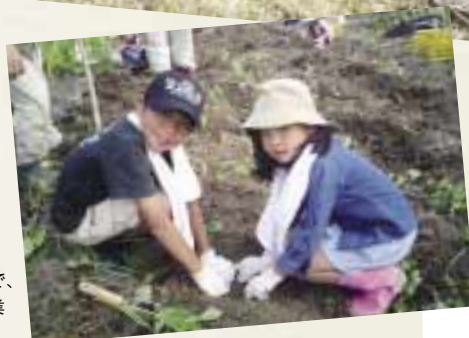
子どもから大人まで、市民を対象に農業体験を実施。