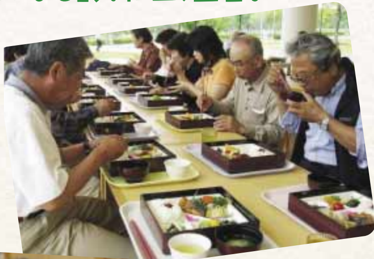
健康と環境をテーマに掲げて活動。「体重減らし隊」は、健康づくりの一貫として、食生活の改善に取り組む。

子どもたちの巣立ちや定年退職者の増加を受け、活力が低下した住宅団地の高齢化対策を目的に「建国」された、葉山ヘルスケア・省エネ共和国。健康や住みよい地域づくりという視点から、身近でできる省エネに取り組んでいます。自らの資金と技術による「省エネナビ」の設置と解析、看護大学や企業などと連携した健康管理、地区の環境デーと連動したノーマイカー運動など、取り組みやすく効果的な活動は着実な成果を挙げ、地域全体に広がりを見せています。