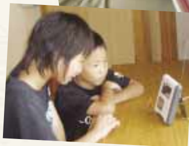
「省エネナビ」を設置して、省エネの効果を検証。省エネ行動の成果がすぐにわかるため、子どもたちにも好評。