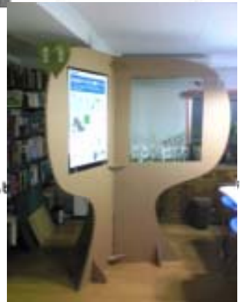
パネル台イメージ