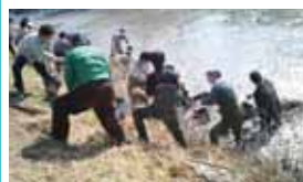
元気・勇気・活気の会