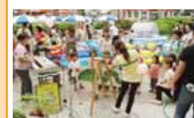
ユーカリが丘 親子の日実行委員会