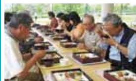
葉山ヘルスケア・省エネ共和国