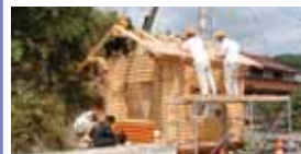
京都府立北桑田高等学校 森林リサーチ科