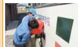
社会福祉法人創志会 つくばライフサポートセンターみどりの