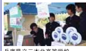
兵庫県立三木北高等学校 環境研究サークルECO-P