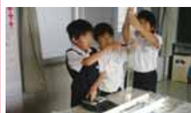
三豊市立下高瀬小学校