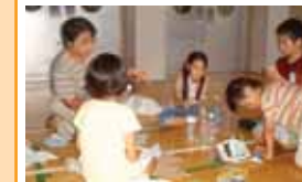
NPO法人 川口市市民環境会議