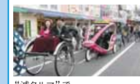
“減クルマ”でまちづくり実行委員会