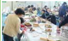
地域ぐるみ環境ISO研究会