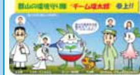
チーム環太郎 (郡山市環境保全課)