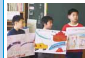
五戸町立南小学校