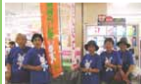
マイバッグもってこ運動協議会