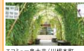
エコムーブ奥大井(川根本町)地球温暖化対策地域協議会