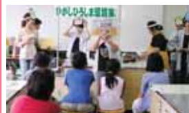
ひがしひろしま環境家族