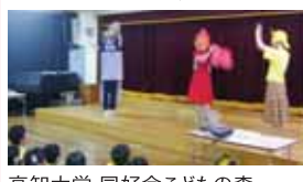
高知大学 同好会こどもの森 (初等教育・環境教育研究会)