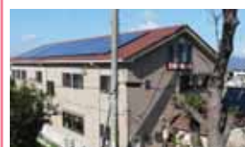
NPO法人 太陽と緑の会