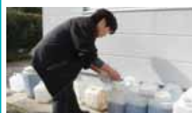
バイオマス研究会、宮崎市