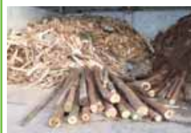
東濃ひのき製品流通協同組合