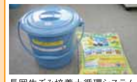
長岡生ごみ培養土循環システム協議会(ながおカベツの会)