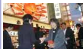
大阪あめちゃん大作戦・推進本部