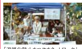
「温暖化防止まつやまネットワーク」学生ワーキンググループ