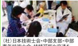
(社)日本技術士会・中部支部・中部青年技術士会・持続可能な交通を考えるワーキンググループ(TMO)