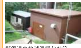
那須温泉地球温暖化対策地域協議会