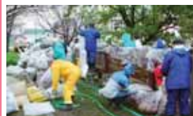
上乃木2区自治会連合会