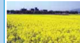
秋田菜の花ネットワーク