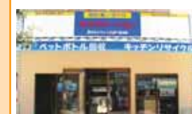
厚木なかちょう大通り商店街 振興組合