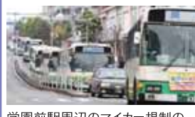
学園前駅周辺のマイカー規制の取り組み(奈良交通(株))