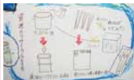
彦名地区チビッコ環境パトロール隊