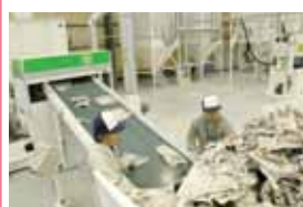
株式会社 安成工務店