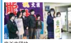
塩釜市団地水産加工業協同組合