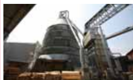
銘建工業株式会社