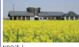
NPO法人 菜の花プロジェクトネットワーク