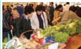
チーム・リサイクル(し)隊